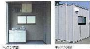
キッチン内部 キッチン外観