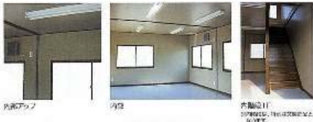
内部アップ 内部 内部階段